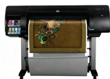
Impresora fotográfica HP Designjet Z6100 de 1.067 mm

Esta impresora HP Designjet de gran formato proporciona hasta 105,4 m 2 de salida por hora, calidad fotográfica duradera con 8 tintas pigmentadas HP Vivera y una extraordinaria uniformidad del color con un espectrofotómetro integrado 1 .