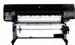
Impresora fotográfica HP Designjet Z6100ps de 1.524 mm

Ideal para proveedores de servicios de impresión, tanto laboratorios de producción de fotografía como empresas de arquitectura, ingeniería y GIS que desean reducir su tiempo de respuesta y producir aplicaciones de interiores de gran impacto y alta calidad con colores precisos y de larga duración, como cartelería para punto de venta, impresiones fotográficas, arte digital, dibujos, mapas y presentaciones.