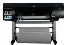
Impresora fotográfica HP Designjet Z6100ps de 1.067 mm