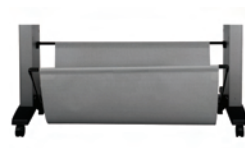
Q6714A Bandeja de soporte de 60 pulgadas/1524 mm para HP Designjet