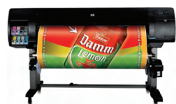
Impresora fotográfica HP Designjet Z6100 de 1.524 mm