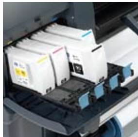
Cartucho de tinta negra HP grande

7 Comparado con cualquier impresora HP Designjet 600/700/800/1000