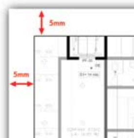
Márgenes de 5 mm