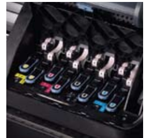
Tecnología de doble barrido HP